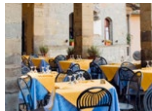
La Locanda nel Loggiato

10 La Locanda nel Loggiato, Cortona Kaart F4 ■ Piazza di Pescheria 3 ■ 0575-630575 ■ Gesloten wo ■ € De gasten komen hier voor het balkon met uitzicht en genieten van de Toscaanse gerechten, gemaakt van heerlijke lokale seizoensproducten.