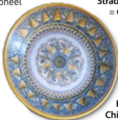
Aardewerk, L'Antico Cocciaio

10 Sotto San Francesco, Arezzo Kaart F3 ■ Via di S Francesco 5 Een overvloed aan wijnen, olijfoliën en kunstnijverheid, onder meer kant uit Aghiari, keramiek uit Monte San Savino en smeedijzer.