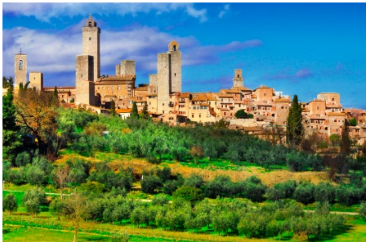
Het sfeervolle stadje San Gimignano

De sobere gevel verloochent het interieur met de vele fresco's ( onder ). Rechts ziet u fresco's van Lippo Memmi (1333–1341), links van Bartolo di Fredi (1367), in het schip het bloederige Laatste Oordeel (1410) van Taddeo di Bartolo en bij de ingang St. Sebastiaan (1464) van Benozzo Gozzoli. De trots van de stad is de fresco-cyclus van Domenico Ghirlandaio (1475) in de Capella di Santa Fina.