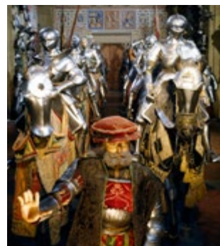
Expositie in het Museo Stibbert

Grappig wapenmuseum, gesticht door Frederick Stibbert. De 16de-eeuwse Florentijnse wapencollectie in de grootste zaal is opgesteld als een marcherend leger (blz. 84).