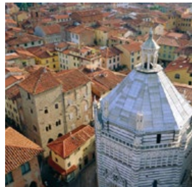
Luchtfoto van de Duomo, Pistoia

Een oude Romeinse stad van metaalwerkers: de dolken, die zich ontwikkelden tot handvuurwapens, werden naar deze stad pistole genoemd. De romaanse strepen van San Giovanni Fuoricivitas en Duomo (blz. 59) ontmoeten hier het terracotta van de Florentijnse renaissance in de Ospedale del Ceppo. Gotisch zijn de fresco's van de Cappella del Tau en een kansel van Giovanni Pisano (1298-1301) in de kerk van Sant'Andrea.