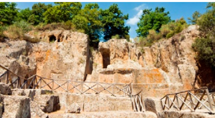
Tombe van Ildebranda in de Etruskische necropolis in Sovana