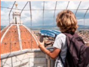
Zicht vanaf de Duomo in Florence