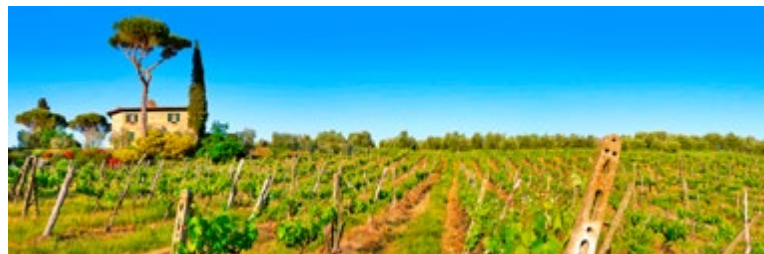
Wijngaarden zover het oog reikt in de Toscaanse streek Chianti