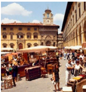
De antiekmarkt van Arezzo

6 Gelataria Artigianale Cremi, Arezzo Kaart F3 ■ Corso Italia 100 Heerlijke biologische gelato, met creatieve en klassieke smaken zoals fiordilatte (melk). Ook yoghurtijs.