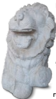
Beeld, Romeins theater, Fiesole

De weelderige heuvels rond Florence en het weidse Arnodal worden door veel toeristen over het hoofd gezien. Verlaat de hoofdweg en ontdek plekjes die alleen bekend zijn bij de lokale bevolking. Er is geen mooiere route naar Siena dan de S222 Chiantigiana via het beroemde terracotta-centrum Impruneta en de met kastelen en wijngaarden bedekte heuvels van de Chiantistreek. Prato en Pistoia staan in de schaduw van hun machtige burens, maar hebben eveneens een rijke erfenis aan romaanse bouwwerken en renaissancekunst. Het platteland ten noordwesten van de stad is bezaaid met villa's gebouwd door de Medici.