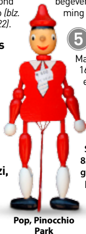
Pop, Pinocchio Park

www.museoragazzi.it Een reeks wisselende workshops in het Palazzo Vecchio (blz. 83), het Museo Novecento en het Museo Stibbert. Kinderen mogen de verborgene delen van het Palazzo Vecchio verkennen, met telescopen van Galilei spelen en zich als een Medici verkleden.