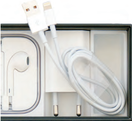
De accessoires van de iPhone.

In de doos zit meer dan alleen uw iPhone. In de omslag vindt u een boekje met productinformatie, daaronder treft u de accessoires aan.